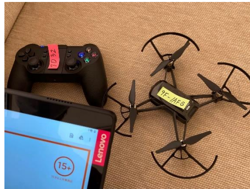
参考写真 左：ドローンの飛行の様子 右：プログラミング教室で使用するドローン

【お問い合わせ】 富山県立大学 工学部 知能ロボット工学科 教授 岩井 学（総括） 電話 0766-56-7500（内線 1393）