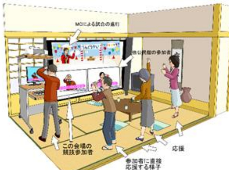
図5 2つの会場をオンラインで接続した競技イメージ