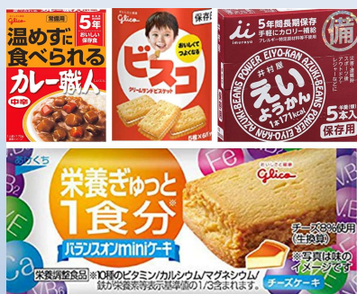
食べてみよう、防災・非常食！