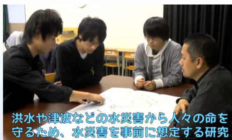
洪水や津波などの水災害から人々の命を守るため、水災害を事前に想定する研究