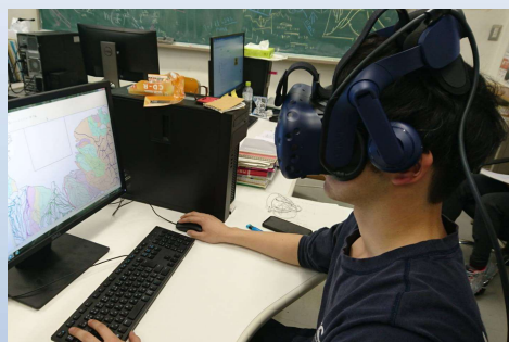
VRで洪水災害を体験！