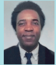
情報基盤工学講座