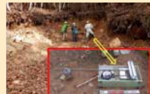
土石流源頭部で発生した斜面崩壊における土質試験 (現場一面せん断試験)