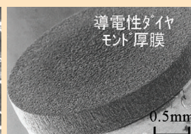
導電性ダイヤモンド 小径軸付砥石

机上放電ツルニング法はダイヤモンド砥石先端部を微細に成形し、マイクロ形状の研削加工を可能とします。また、近年開発された導電性ダイヤモンドは、マイクロ流路金型やマイクロレンズ金型等の加工に用いられる微小砥石への適用が期待されます。