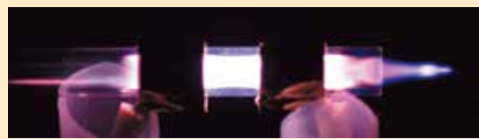
大気圧誘電体バリア放電プラズマジェット