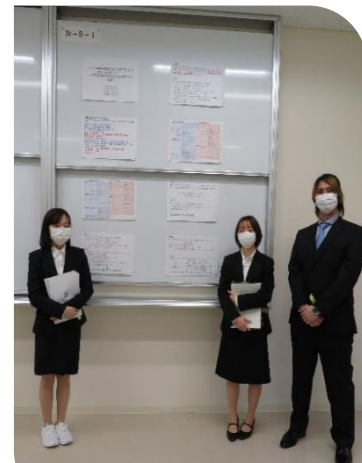
人工呼吸器装着有無の意思決定に関する文献レビュー —在宅療養を望む本人と家族への支援—