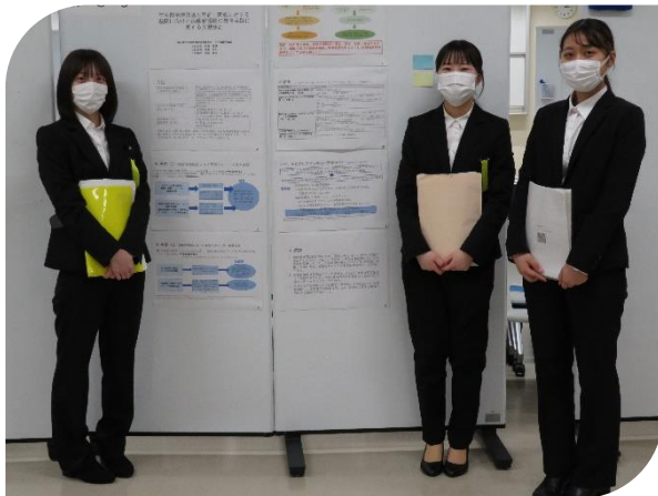
在宅酸素療法導入患者・家族に対する退院に向けた 病棟看護師の教育実践に関する文献検討