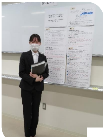
地域在住高齢者の社会活動への 参加促進に関する文献検討