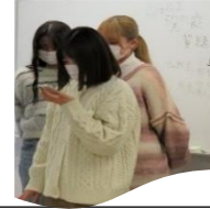
『一年間のまとめ —老々介護・コミュニケーション・訪問看護—』