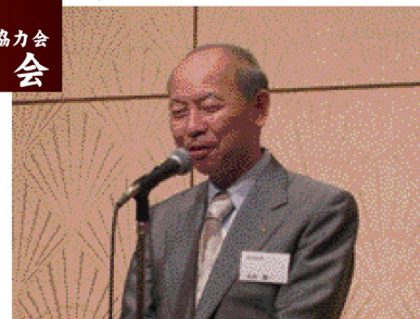
▲ 来賓挨拶 / 富山県知事 石井隆一氏