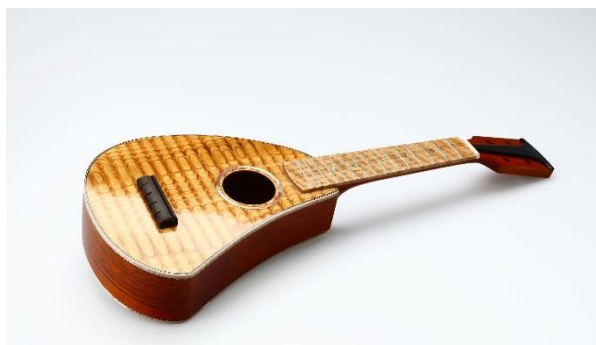
図1 圧縮スギ材で製作したウクレレ

我々は富山県産のスギの木、しかも間伐材という入手しやすいスギの木を圧縮成型して製作した圧縮スギ材に着目し、これを用いてウクレレを製作し、ローズウッドで製作したものと比較しました。その結果、各弦を弾いた時の木材の振動特性や発生音は両方で類似したものとなりました。このため、富山県産のスギの木でも輸入木材の代用とできる可能性が見出されました。一方、音の響き方という点ではいくつか課題が見つかりましたので、その課題を解決できるようにします。具体的には、木材の圧縮成型方法や木板の厚さ/形状の変更、木板のコーティングや金属材の貼り付けなどによる発生音の調整可否を調査し、よりローズウッドで製作したものに近いウクレレとできるように進めて行きます。なお、この研究成果について学会発表を行ったところ、聴講者の皆さんからの反応もよく、世間の興味関心もある程度大きそうな印象を受けました。